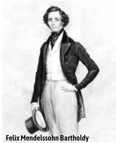
Felix Mendelssohn Bartholdy

Das „ Andante Religioso “ aus der 4. Orgelsonate von Felix Mendelssohn-Bartholdy erfreut sich wegen seiner wunderbaren Melodie in einer unüberschaubaren Zahl an Bearbeitungen großer Beliebtheit auf der ganzen Welt. Doch im Original – ist es für Orgel.