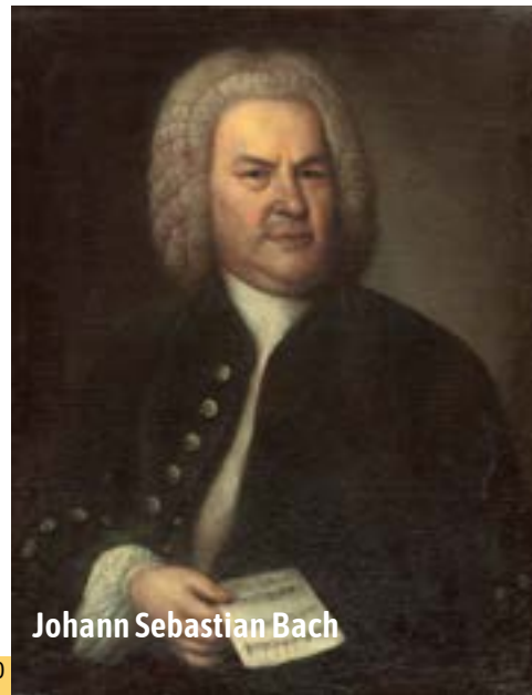
Johann Sebastian Bach

Von Gott will ich nicht lassen, | denn er lässt nicht von mir, | führt mich durch alle Straßen, | da ich sonst irrte sehr. | Er reicht mir seine Hand; | den Abend und den Morgen | tut er mich wohl versorgen, | wo ich auch sei im Land.